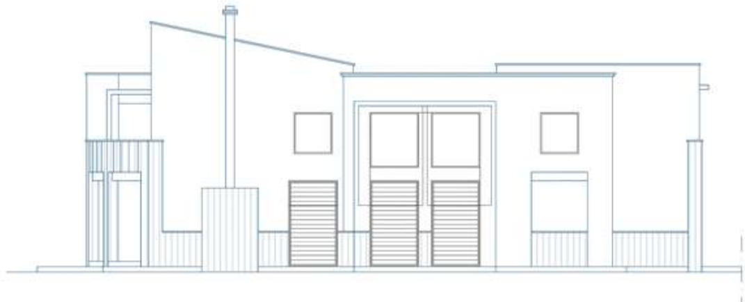
Alzado Lateral Izquierdo